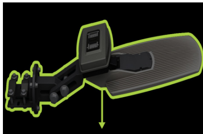
TECNOLOGÍAS DE PUNTA

No contiene materiales de uso restringido o peligrosos, como plomo, mercurio, cadmio, cromo hexavalente, bifenilos polibromados (PBB) o éteres polibromados (PBDE).